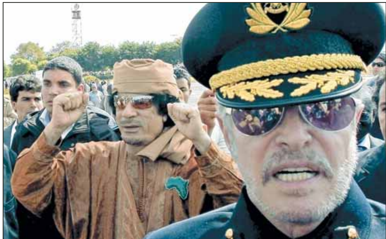
Le maître incontesté de l'Afrique viendra-t-il en avril à Genève, à l'occasion de la conférence Durban II sur le racisme?

SUISSE-LIBYE • Se voit-il déjà planter sa tente bédouine au pied du jet d'eau? Toujours est-il que le colonel Kadhafi envisage de participer à la conférence Durban II sur le racisme, laquelle aura lieu du 20 au 24 avril à Genève. Ce serait aussi l'occasion de régler le