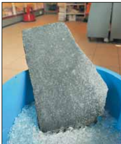
C'est avec cette pierre que les cambrioleurs ont détruit hier la porte en verre du kiosque de la gare à Courtepin. ALAIN WICHT

Selon les premières estimations de la gérance, les voleurs ont surtout jeté leur dévolu, comme lors des deux premiers cas, sur des revues et des dizaines de cartouches de cigarettes. Et plus particulièrement des paquets de marque Marlboro... Quant aux dégâts matériels occasionnés – bris de glaces – ils se montent à plusieurs milliers de francs selon les spécialistes. I