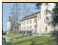
Moulinart? Non, Villars-les-Moines